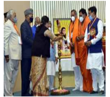
वी वी न्यूज

श्री गुरु रविदास विश्व महापीठ राष्ट्रीय अधिवेशन-2021 राज्यपाल ने किया प्रतिभाग